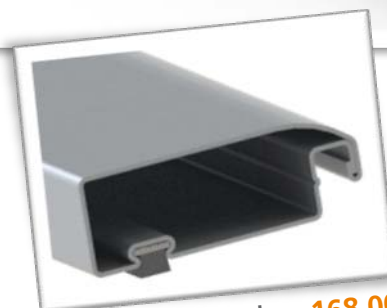
Brosse obturatrice: 168 000