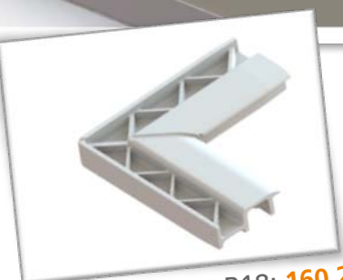
Coin intérieur R18: 160 201