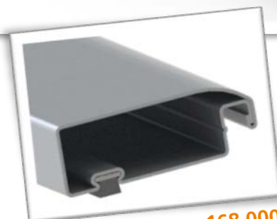
Bürstendichtung: 168 000