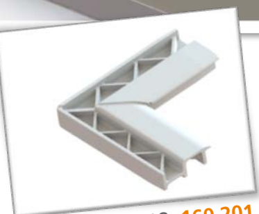
Innenecke R18: 160 201