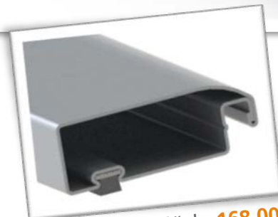
Těsnící kartáček: 168 000