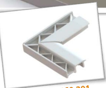
Vnitřní roh: 160 201